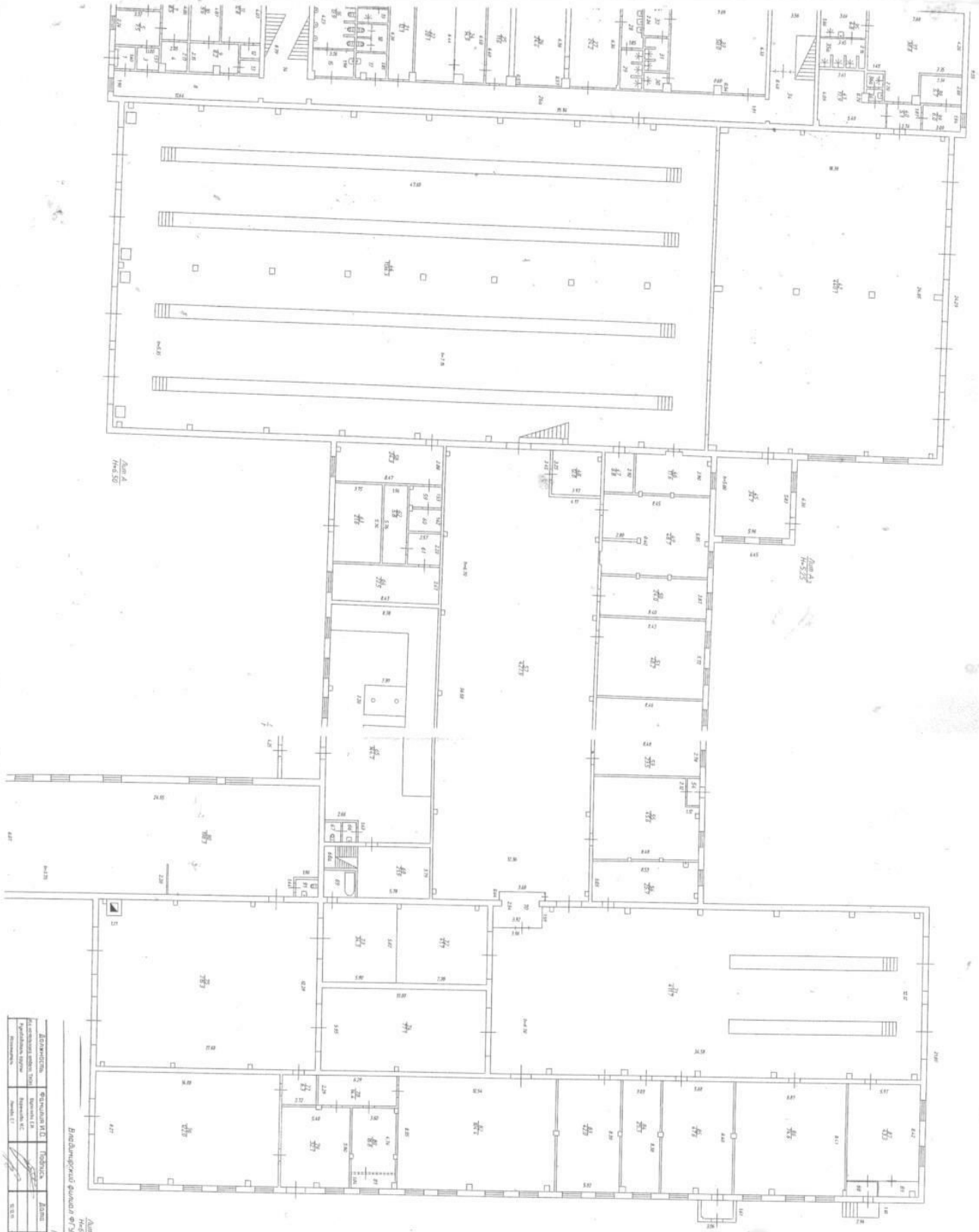
Анн. А № 317 "Техническое задание на проектирование" - "Спецификация ЕТР" Водостокный канал № 317